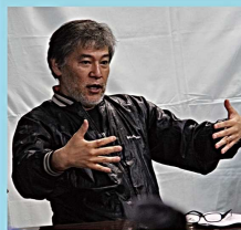
演出 内藤裕敬(ないとう ひろり)

59年生まれ。南河内万歳一座座長。大阪芸術大学在学中の'80年、南河内万歳一座を『蛇姫様』(作・唐十郎)で旗揚げ。以降、全作品の作・演出を手掛ける。現代演劇の基礎を土台にした作品・演出には定評があり、劇団以外にも兵庫県立ピッコロ劇団や、母校大阪芸術大学特別公演などを演出。世界的ピアニスト仲道郁代など異ジャンルとのコラボ企画も多い。 '00年、読売演劇大賞、優秀演出家賞受賞。 '07年と'10年、文化庁芸術祭・優秀賞を受賞。 '19年、大阪文化祭賞を受賞。 '15年より大阪芸術大学舞台芸術学教授。